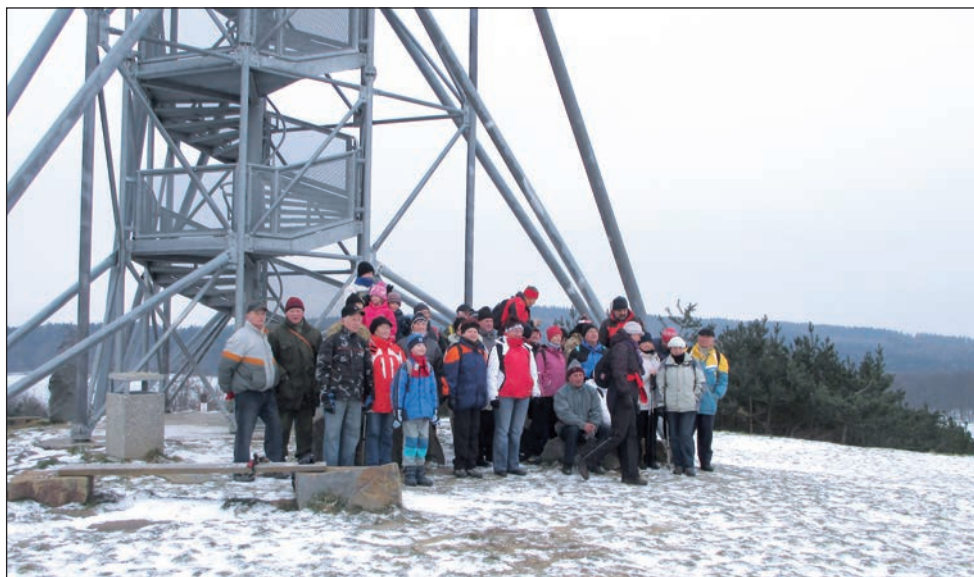
Účastníci Silvestrovského pochodu neopomněli navštívit dominantu Drnovic - rozhlednu Chocholík.