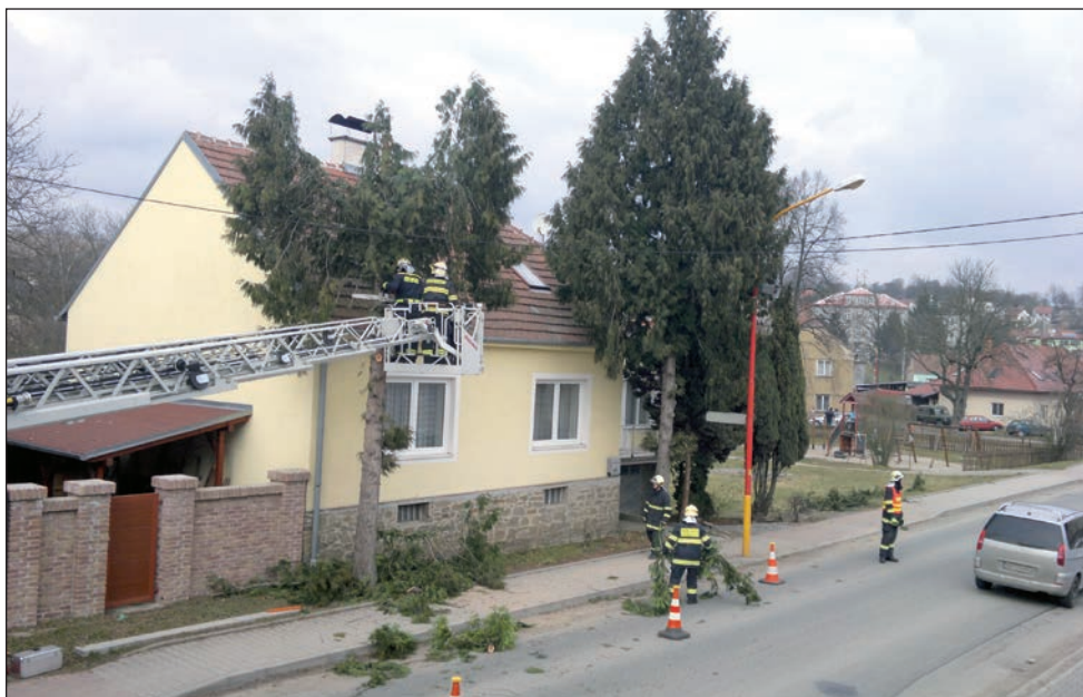
Odstranění stromů v naší obci