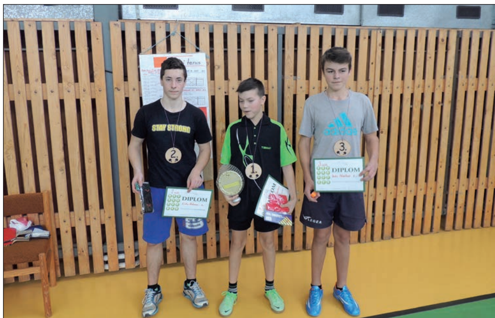
Stolní tenis - chlapci