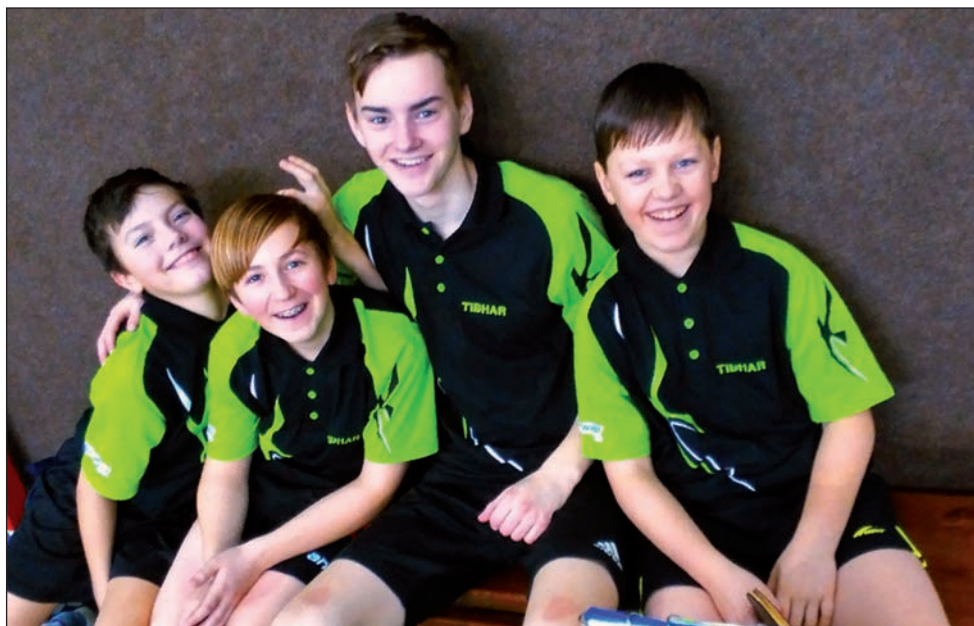
Dorostenci stolního tenisu