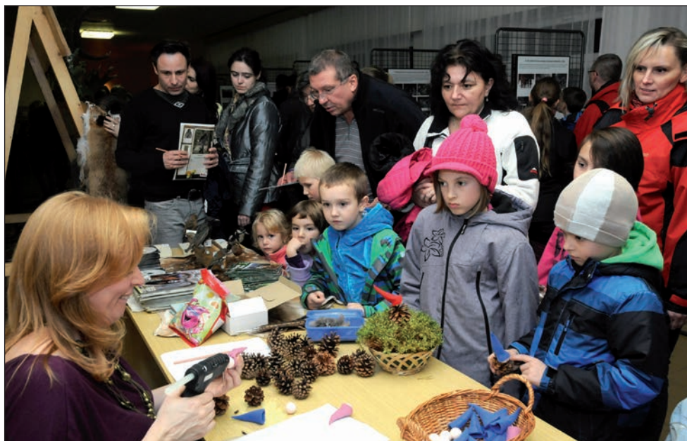
Výstava k 65. výročí založení MS Amálka