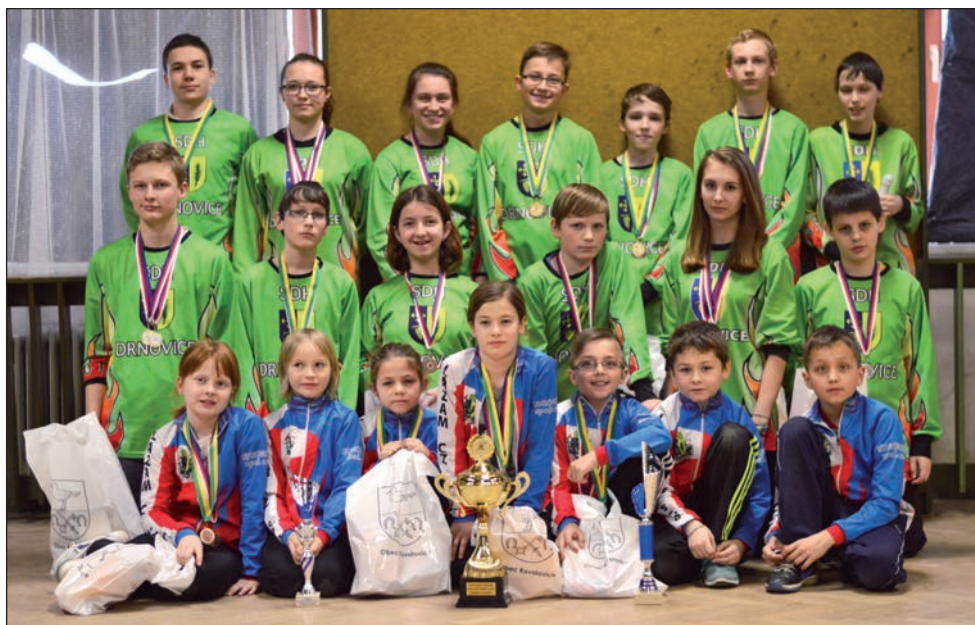
Mladší a starší žáci při soutěži v uzlování