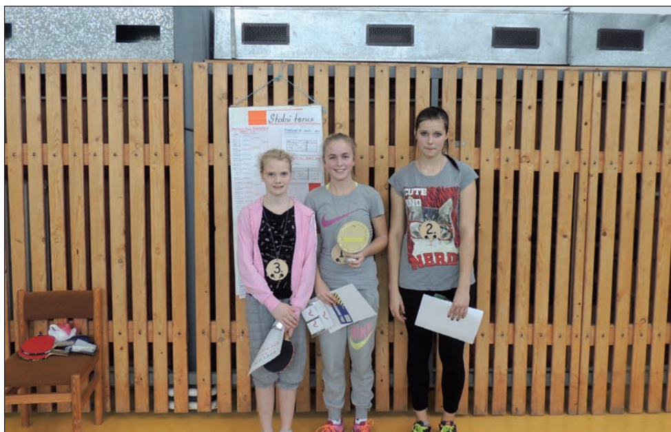
Stolní tenis - dívky