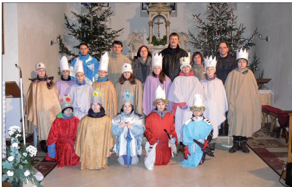
Koledníci a vedoucí skupinek s duchovním rádcem naší jednoty