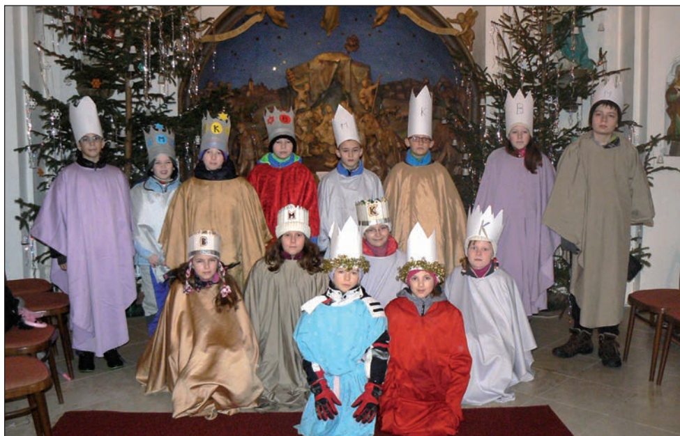
Koledníci před Betlémem