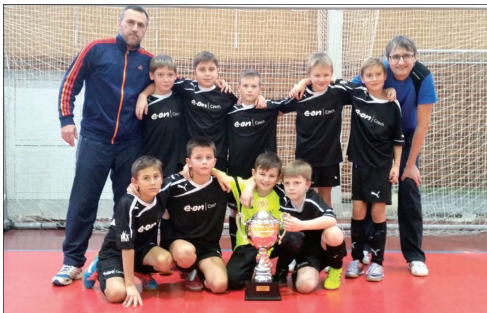
FKD starší příprava - O pohár předsedy KMTM OFS Vyškov - 1 místo