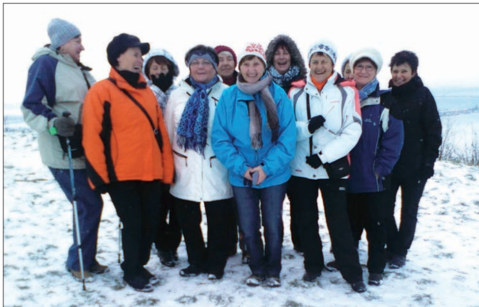
Oddíl Žen na zimní vycházce