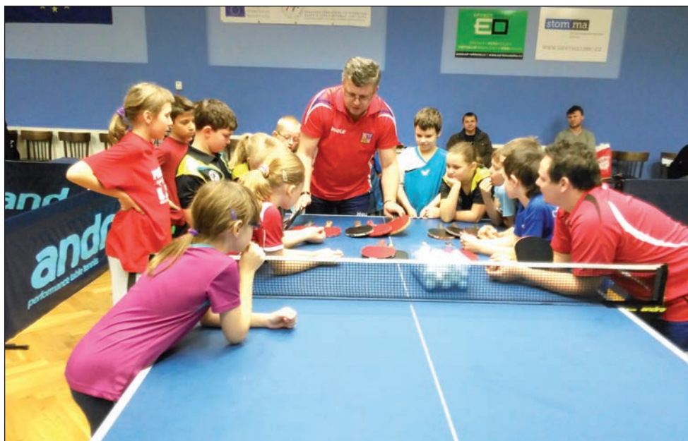
Hledáme budoucí olympioniky