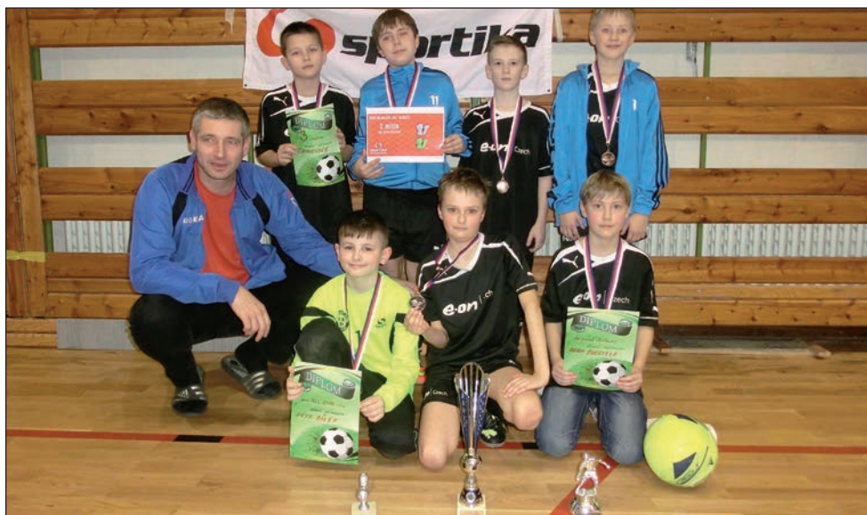
FKD starší přípravka ročník 2004 - Sportika halová liga 3 místo