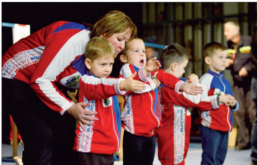
Soustředění našich nejmenších hasičů při uzlové stafetě