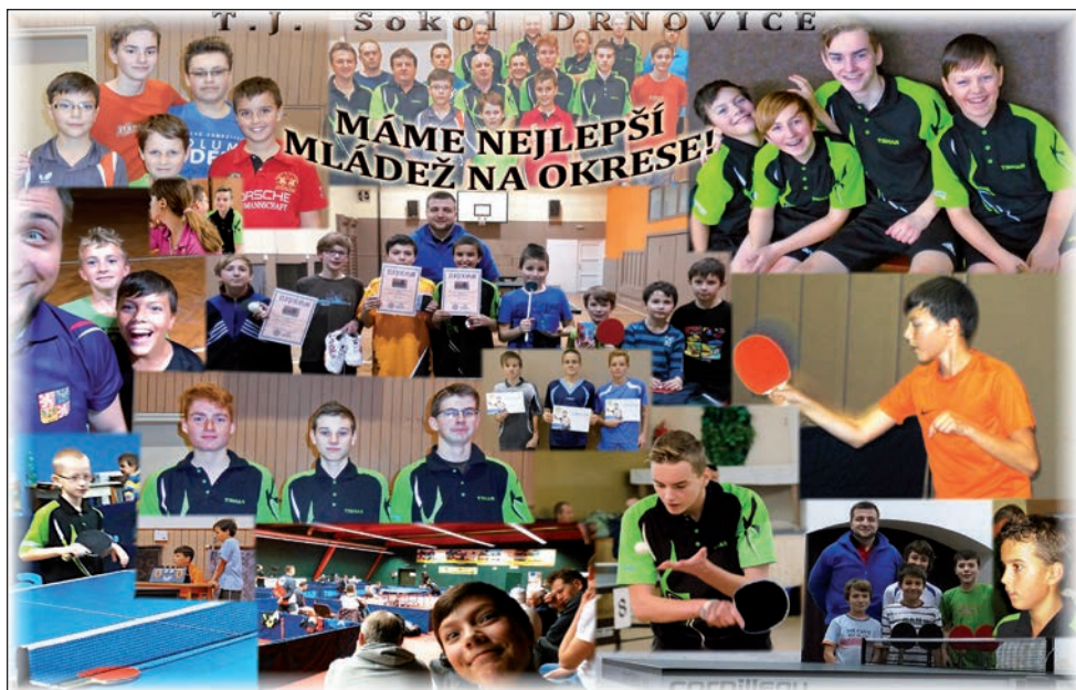
Plakát Stolního tenisu