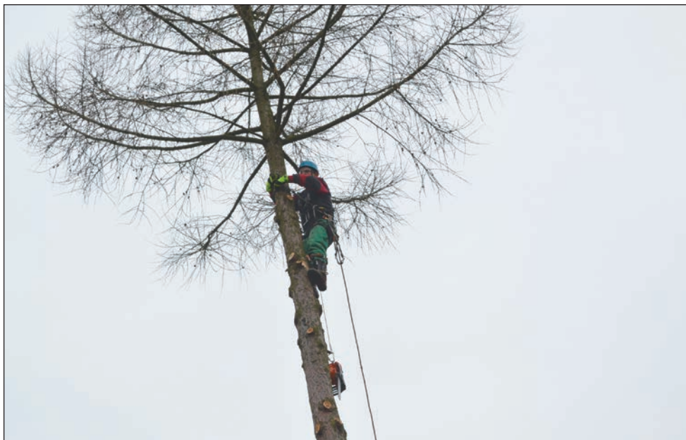
Odstranní stromů pomocí lezecké techniky