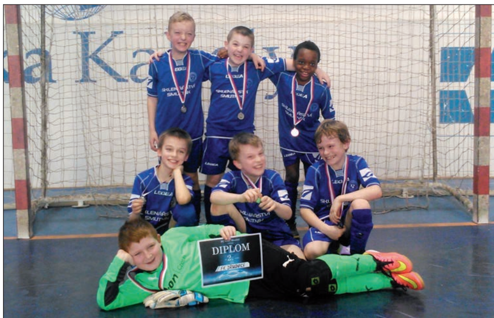
FKD starší příprava ročník 2005 - Turnaj Velké Meziříčí - 2 místo