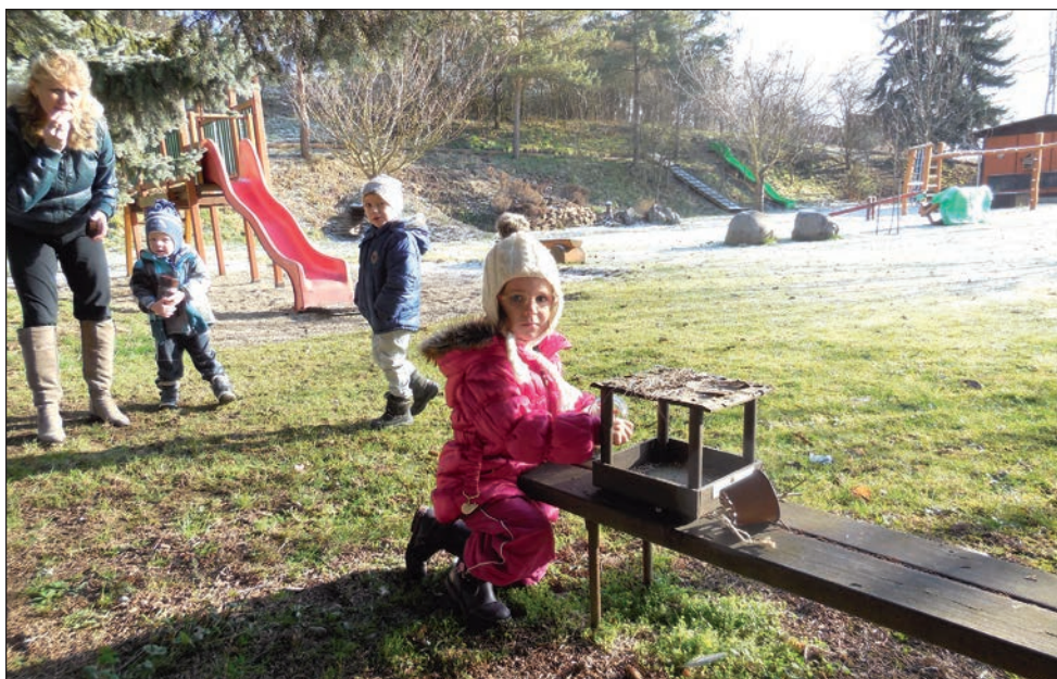
Staráme se o ptáčky