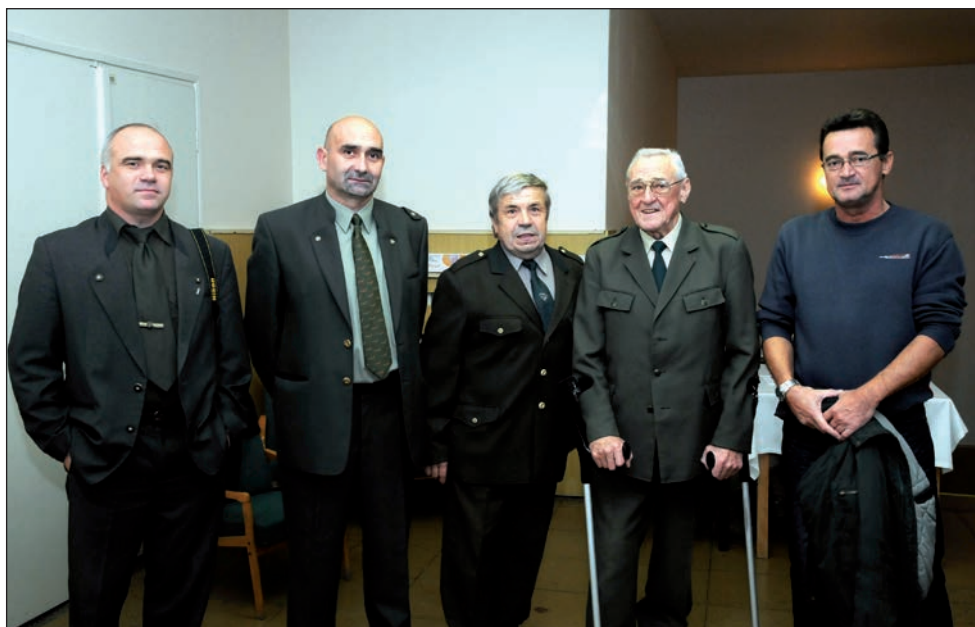
Výstava k 65. výročí založení MS Amálka